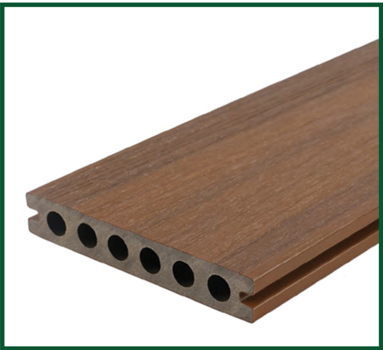
Tabla compuesta de 95% de materiales reciclados de polietileno de alta densidad y fibras de madera. Interior hueco redondo con canales laterales para su instalación. Textura: H1/H6