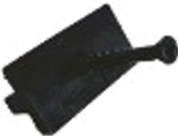
TC-2 Bastidor de madera

*Para mayor información consultar la guía de instalación deck.