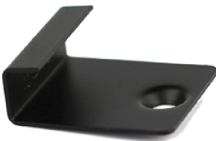
MG-3 Clip de inicio