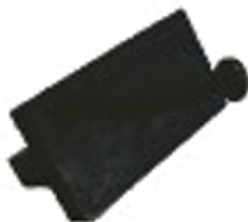
TC-2-JB Bastidor de metal